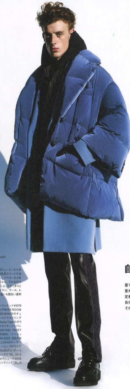
Styling JUNYA CHINO Hair TAKAYUKI HUKUI Model DANYA